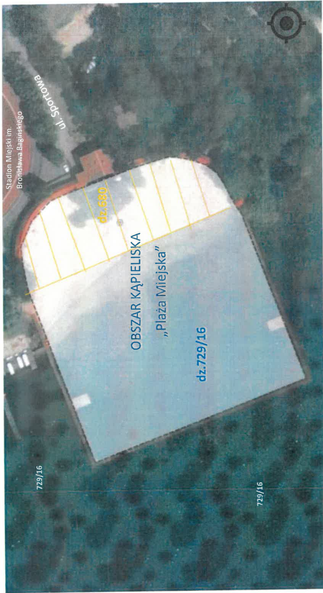
Załącznik nr 2 do uchwały Rady Miejskiej w sprawie określenia sezonu kąpielowego oraz wykazu kąpielisk w Gminie Barlinek